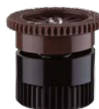
Сопло 8А Радиус: 2,4 м