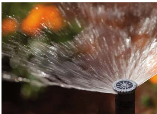
Регулируемое сопло Precision Distribution Control™

Примечание: Встроенный регулятор давления Pro-Spray PRS30 контролирует давление до максимума 2,1 бар; 210 кПа. Для достижения указанных радиуса и скорости потока может понадобиться регулировка винта настройки радиуса.