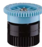
Сопло 6А Радиус: 1,8 м