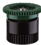
Сопло 12А Радиус: 3,7 м