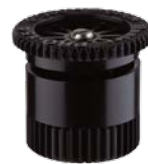
Сопло 15А Радиус: 4,6 м