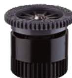
Сопло 17А Радиус: 5,2 м