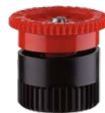
Сопло 10А Радиус: 3,0 м