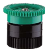
Сопло 4А Радиус: 1,2 м